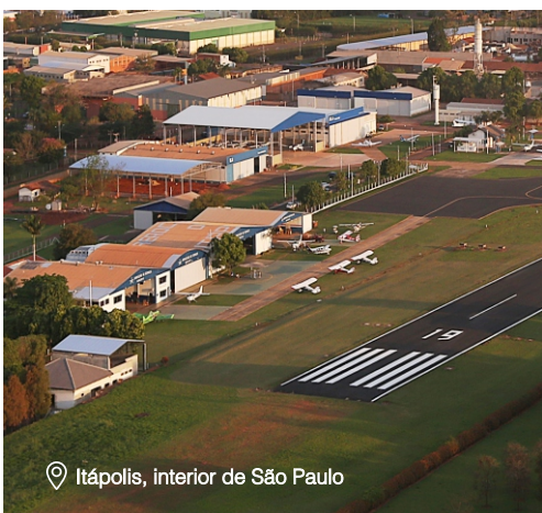
📍 Itápolis, interior de São Paulo

A EJ é a maior escola de aviação da América Latina